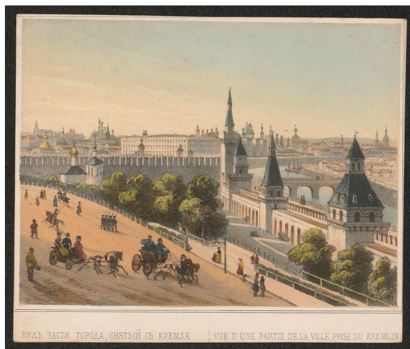
204J9/24 : cartes postales de Moscou d'Alexis de Saint-Priest (s.d.).