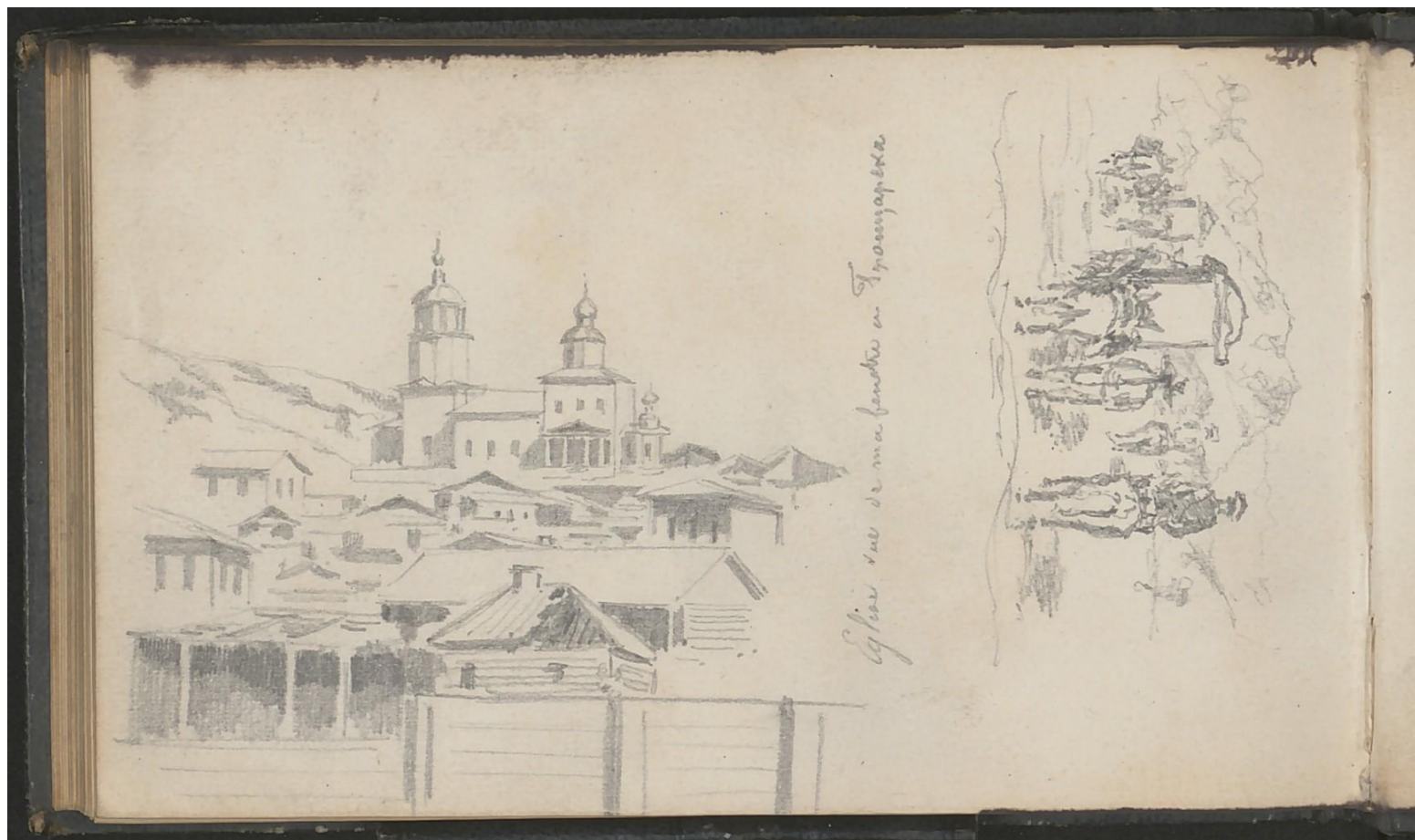
204J9/28 : Voyage en Chine, carnet de notes et croquis [1859].