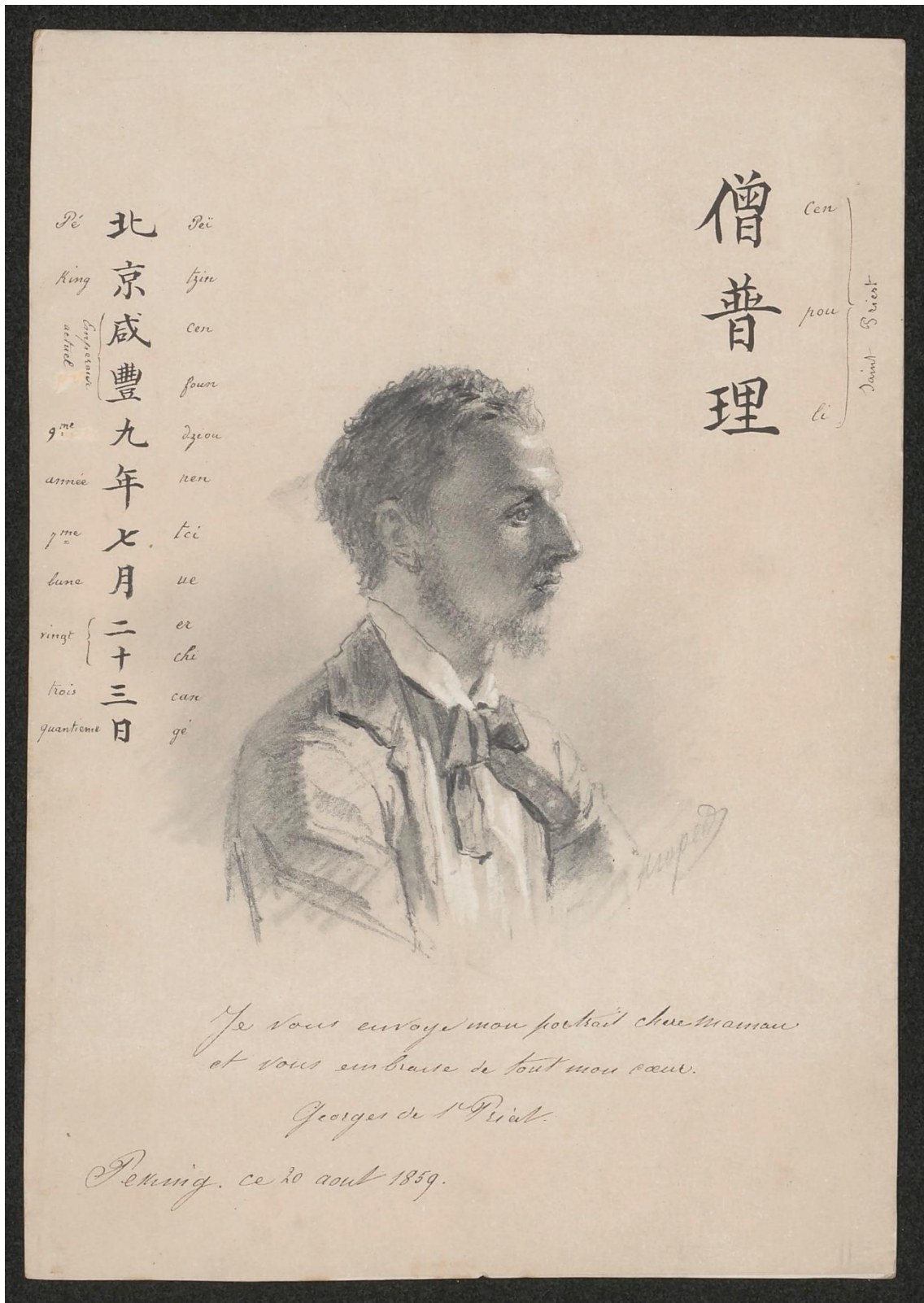
204J9/28 : portrait de Georges de Saint-Priest (20 août 1859)