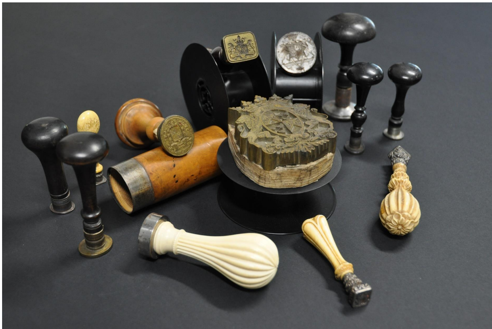
204J9/50 13 tampons à sceau Saint-Priest (s.d.).