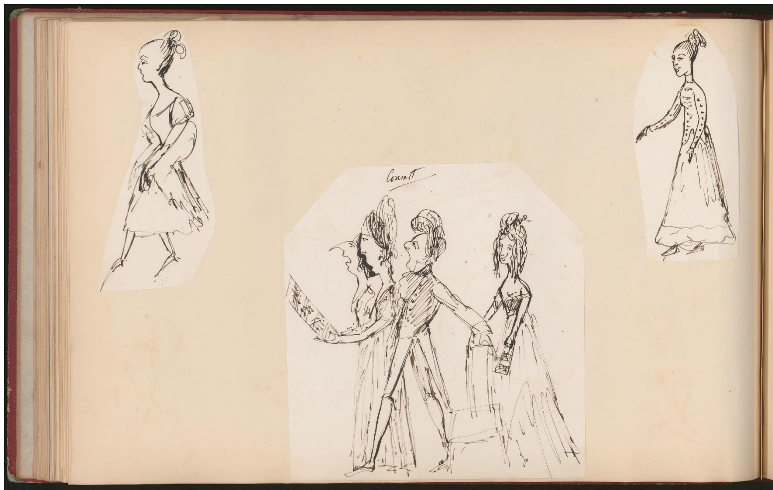
204J9/17 : extrait du grand album de caricatures à l'encre d'Alexis de Saint-Priest (s.d.).