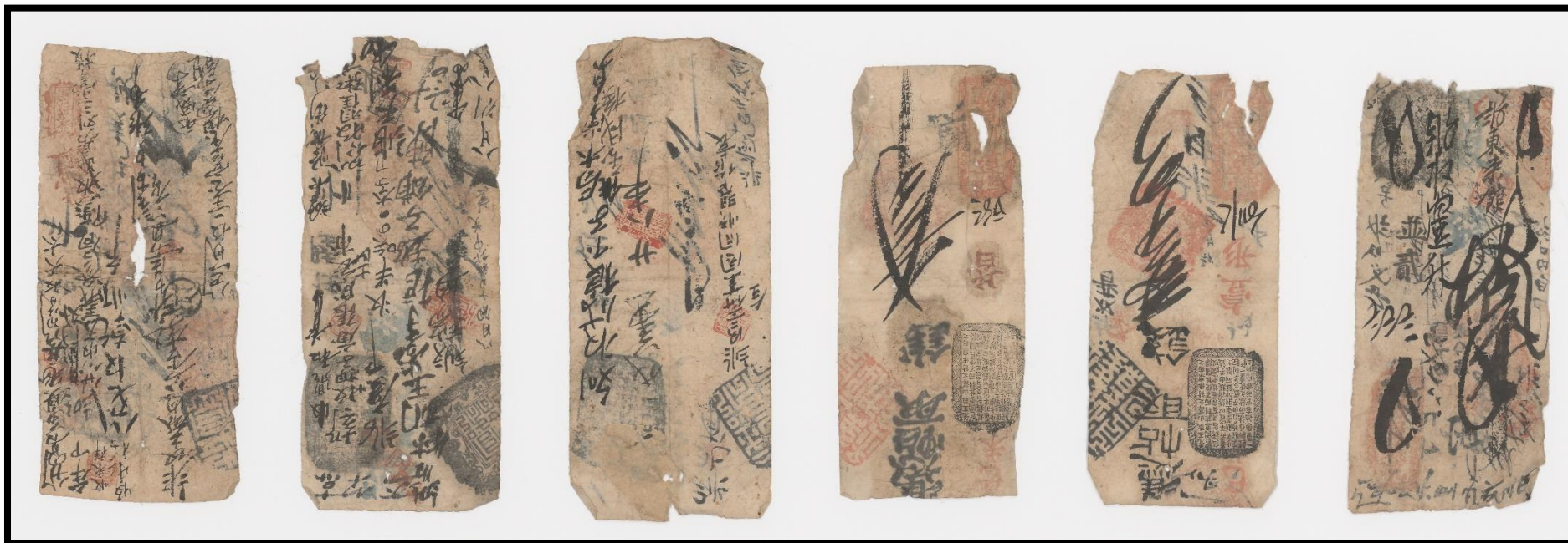
204J9/28 : 6 petites pièces de papier de riz portant sceaux et calligraphies chinoises (s.d.)