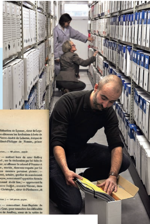
Inv B 1