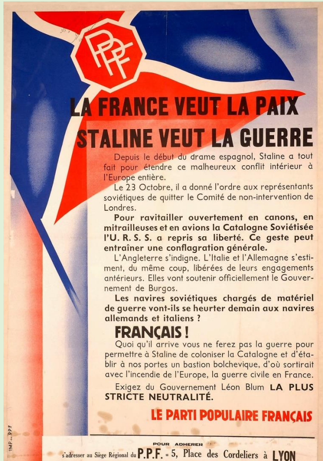
Affiche du Parti Populaire Français, fin 1936. ADI, 10 Fi 424

L'analyse des documents constitue le cœur de l'exercice, mais elle doit, pour être menée à bien, s'appuyer sur des connaissances personnelles.