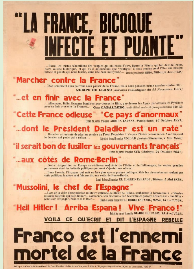
Affiche du Comité de coordination et d'information pour l'aide à l'Espagne républicaine, 1938. ADI, 10 Fi