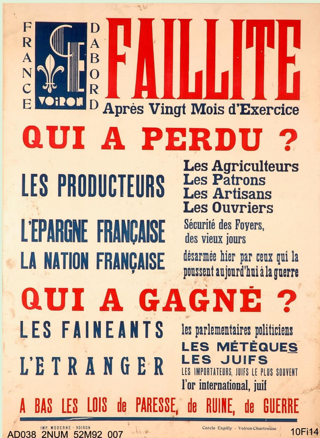
Affiche du Cercle Expilly de Voiron, 1938. ADI, 10 Fi 14

L'analyse des documents constitue le cœur de l'exercice, mais elle doit, pour être menée à bien, s'appuyer sur des connaissances personnelles.