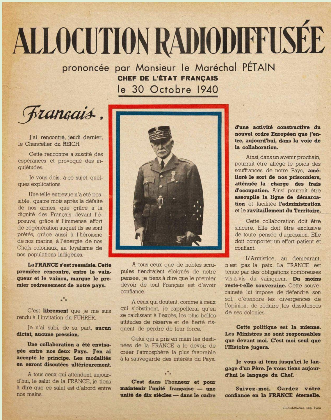
Affiche de l'Etat Français, 1940. ADI, 13 R 799

L'analyse des documents constitue le cœur de l'exercice, mais elle doit, pour être menée à bien, s'appuyer sur des connaissances personnelles.