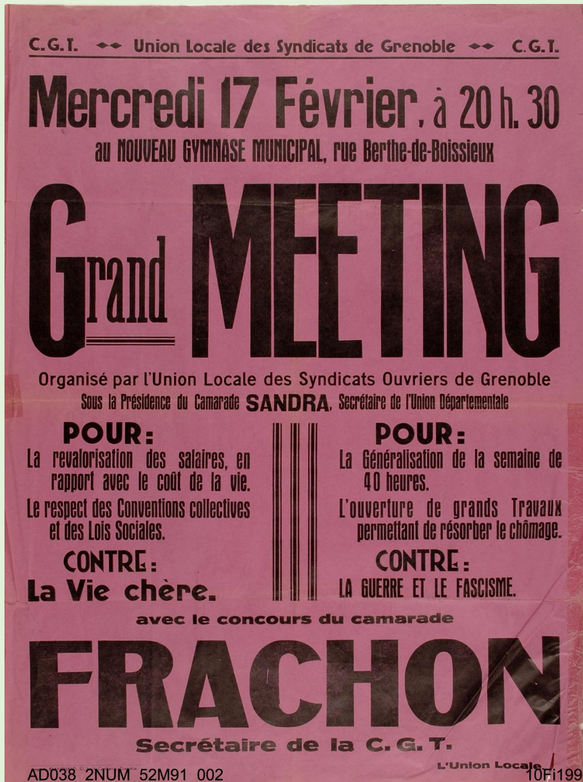
Affiche de l'union locale des syndicats de Grenoble - CGT, 1937. ADI, 10 Fi 199

L'analyse des documents constitue le cœur de l'exercice, mais elle doit, pour être menée à bien, s'appuyer sur des connaissances personnelles.