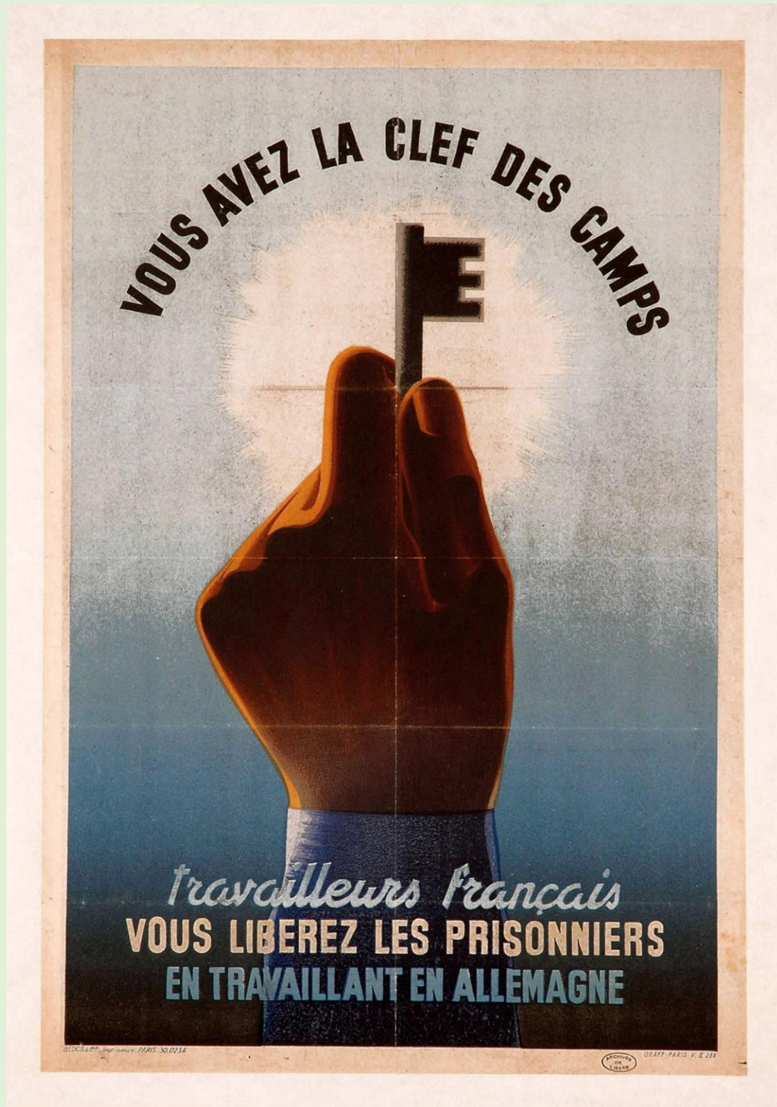
Affiche de l'Etat Français, 1942. ADI, 10 Fi 1944

L'analyse des documents constitue le cœur de l'exercice, mais elle doit, pour être menée à bien, s'appuyer sur des connaissances personnelles.