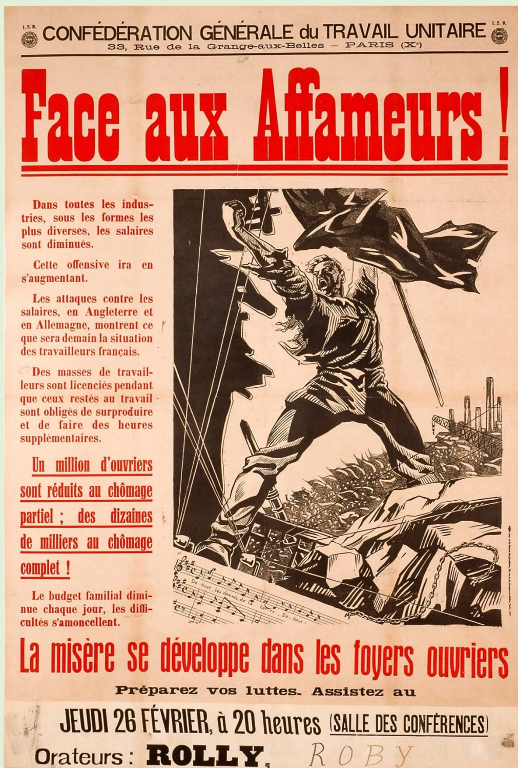
Affiche nationale de la CGTU pour un meeting local (Grenoble), 1931. ADI, 10 Fi 422

L'analyse des documents constitue le cœur de l'exercice, mais elle doit, pour être menée à bien, s'appuyer sur des connaissances personnelles.