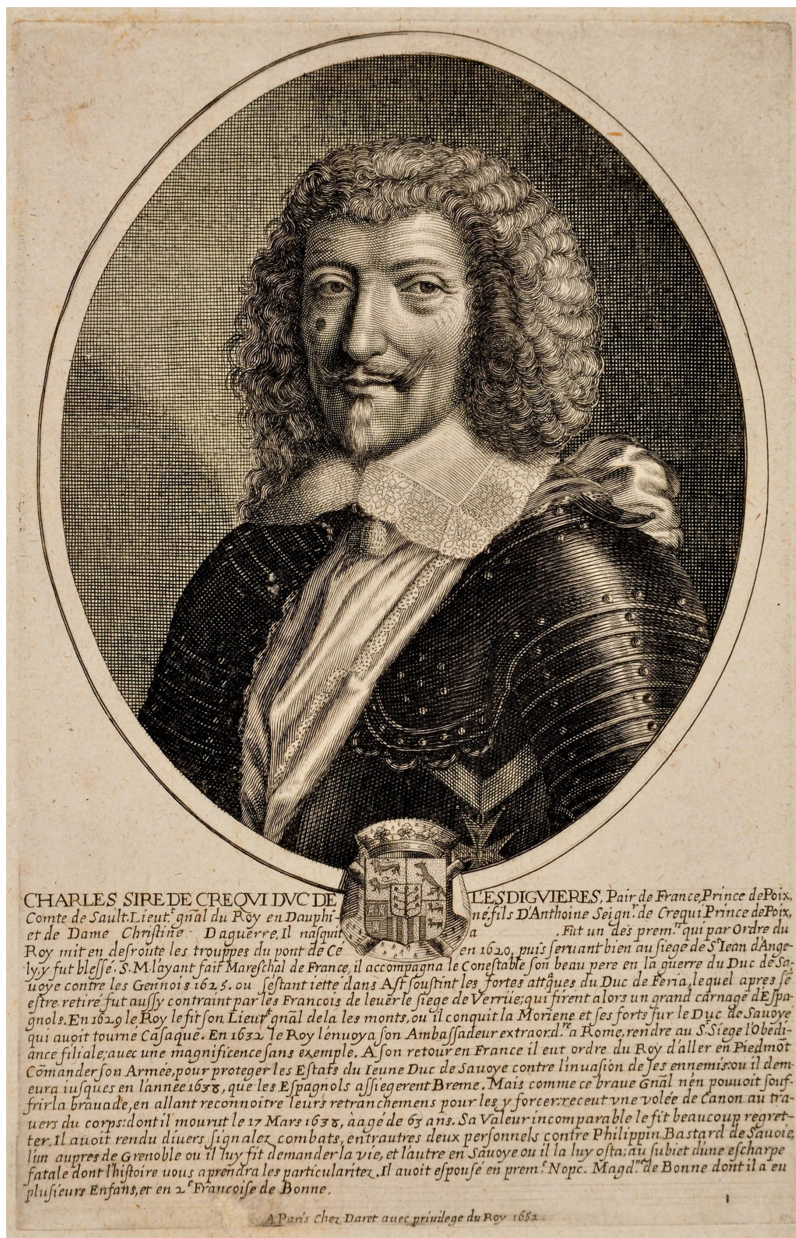
Arch. dép. Isère, cote 7 Fi 246 : « Charles, sire de Créqui, duc de Lesdiguières, pair de France, prince de Poix, / comte de Sault, Lieut(enan)t g(e)n(er)al du roy en Dauphiné (...). À Paris, chez Daret, avec privilège du roy, 1652 », portrait en médaillon accompagné des armes du duc et d'une notice biographique (gravure sur cuivre, 206 x 132 mm).